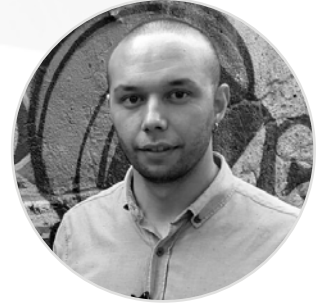
Tolga Yılmaz Grafik Tasarım